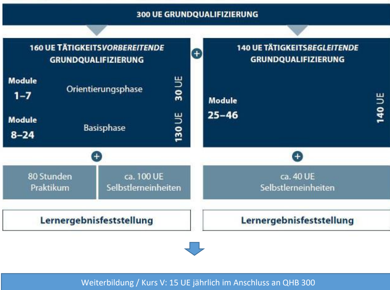
Abbildung: Aufbau der Grundqualifizierung nach dem QHB