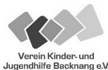
Verein Kinder- und Jugendhilfe Backnang e.V.

Internet: www.kinderundjugendhilfe-bk.de