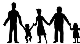
Tageselternverein Waiblingen e.V.