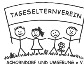
SCHORNDORF UND UMGEBUNG e.V.